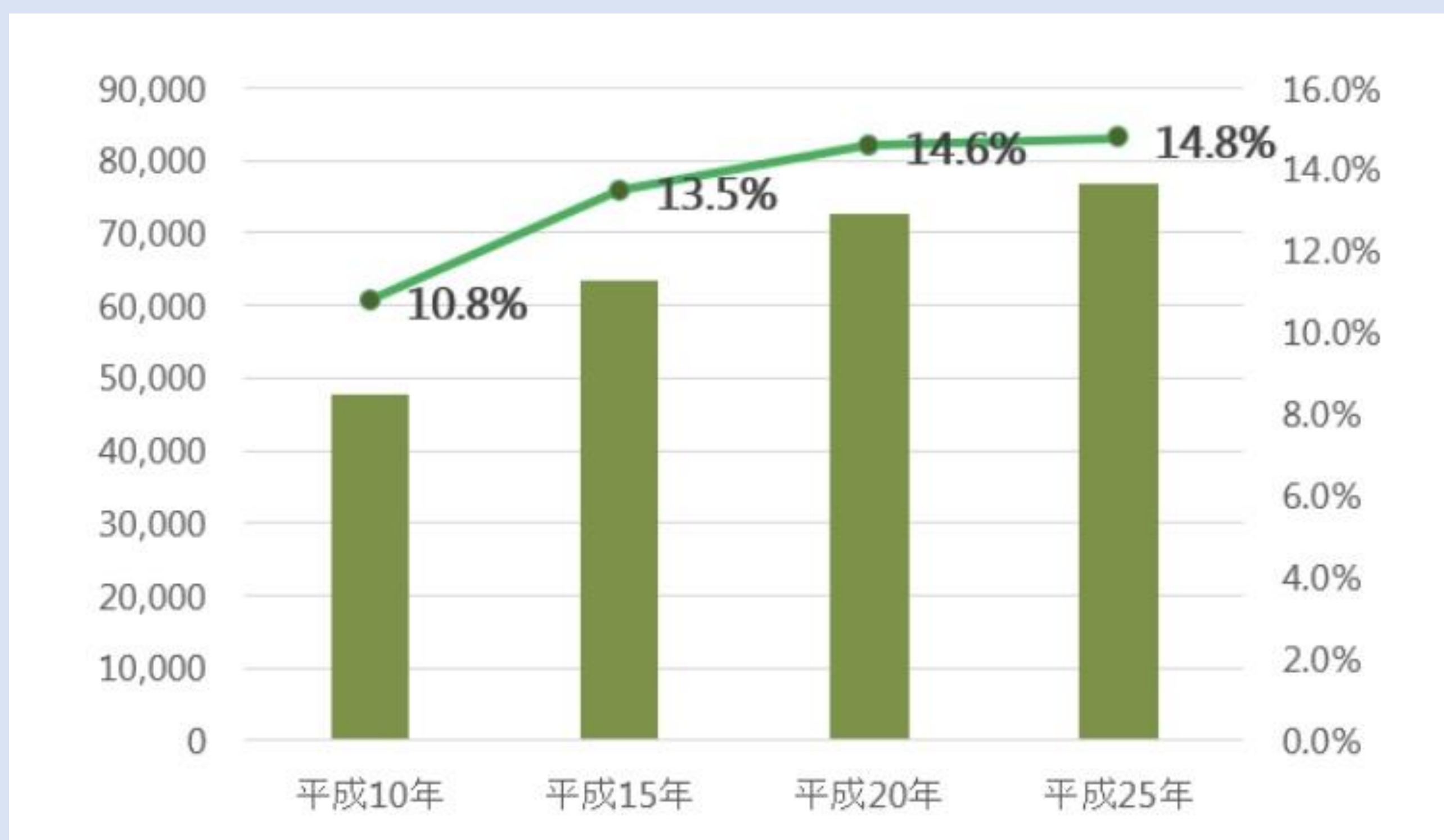
図1 石川県の空き家数と空き家率の推移