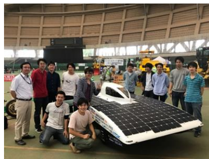
こまつ乗りもの動物園の様子

消防車・パトカーなど様々な乗り物が展示される中、学生たちは太陽光エネルギーを動力とした地球環境にやさしいソーラーカーの紹介や、プロジェクトの取り組みを紹介しました。子供たちにはソーラーカーの運転席に座れる機会もあり喜んでいました。