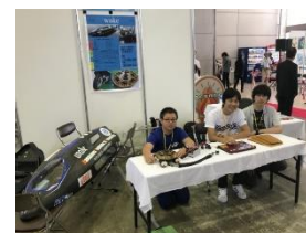
出展ブースの様子

エコランプロジェクトは8月25日(土)・26日(日)石川県産業展示館4号館で開催の環境に関する様々な展示や体験を通じて、人と環境の関わりについて理解を深め、実践していく契機となることを目的とした「いしかわ環境フェア」に出展しました。今回はEV車両「Wake号」を展示しました。メンバーが来場者にボティ・モータの自作を中心に説明を行いました。来場者はもちろん出展企業との交流も深め貴重なフィードバックをいただくことができ、今後の車体製作の参考の機会となりました。