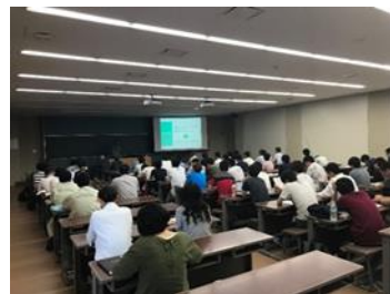
中間報告会の様子