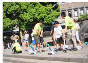
実験を楽しむ参加者の様子